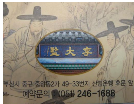
부산시 중구 중앙동2가 49-33번지 산업은행 후문 앞 예약문의 ☎ (051) 246-1688

「ちょっと良いところをこの大感」 「韓国料理に和食のほいところもある食べやすくおいしい料理をいろいろ。」