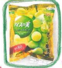
アイスの実 大人のマスケット