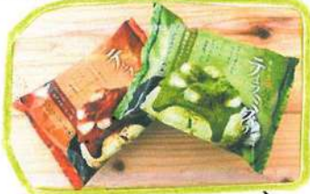
セブンイレブン限定 ティラミスわらびもち