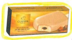
ゴティバチョコレート アイスバーブロードチョコレート(450円!)