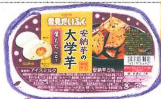
雪見だいふく 大学芋味

まだまだ寒い日が続きますね。梅が咲き始めた所もあるようですが... 春ももうすぐ! 花粉症ももうすぐ!! 今回はアイス特集です。最近では変わったアイスも多いですよ。冬にコタツで食べるアイスも最高!