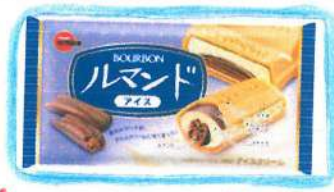
話題の! ルマンドアイス