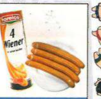
ハラニコソーセージ缶 ¥698(税込)

誰もが好きなたこ焼きは甘辛ソース味のしっかりした味付け。柔らかい食感なので、子供から大人まで好まれそう。ビールやお酒との相性が抜群に良いので晩酌のお供に最適。賞味期限が3年もあるので、保存食としてもお勧めです。