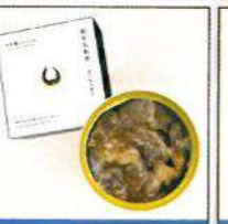
漢方牛大和煮 ¥1,080(税込)