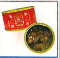
鮭の旨煮(醤油味) ¥432(税込)